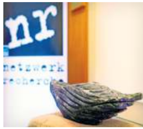
Die „Verschlossene Auster“