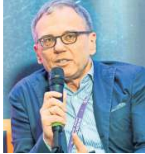
Preisträger Armin Wolf

Viele Journalisten gelten als Nachmenschen, aber was der ORF-Moderator Armin Wolf in den frühen Morgenstunden treibt, ist eher ungewöhnlich. Um halb zwei sei er noch damit beschäftigt, auf Kritik von Zuschauern zu antworten, sagte Wolf auf der Jahrestagung der Journalistenorganisation Netzwerk Recherche, die am Wochenende in Hamburg stattfand. Wolf wurde bei der Veranstaltung mit dem „Leuchtturm für besondere publizistische Leistungen“ ausgezeichnet – nicht nur für seine hartnäckige Interviewfragetechnik, die bei österreichischen Politikern gefürchtet ist, sondern auch für seinen permanenten Dialog mit den Rezipienten. Tausend Reaktionen erhalte er pro Woche, sagt Wolf. Per Mail oder in Form von Tweets oder Facebook-Kommentaren. „Wenn mir Leute eine halbwegs vernünftige Mail schreiben, antworte ich“, sagte der ORF-Journalist. Schließlich sei er, dessen Gehalt durch Rundfunkgebühren finanziert wird, „deren Angestellter“.