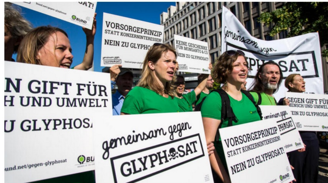
Eine Demonstration von Glyphosat Gegner:innen 2016

30.03.2022 um 18:35 Uhr - Alexandra Conrad - in Öffentlichkeit - 3 Ergänzungen